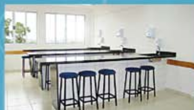
Laboratório de Análises Clínicas