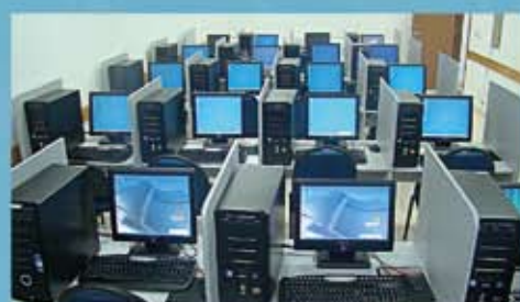
Laboratório de Informática