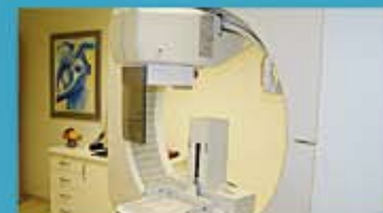
Clinica de Mamografia

O Cenap é a maior escola técnica da rede particular de ensino do Paraná e oferece aos alunos excelente estrutura física, laboratórios amplos e arejados, totalmente equipados proporcionando conforto e maior aprendizado nas aulas práticas, biblioteca com acervo atualizado e computadores com acesso a internet, além de professores qualificados e uma equipe de suporte pronta a atender suas necessidades.