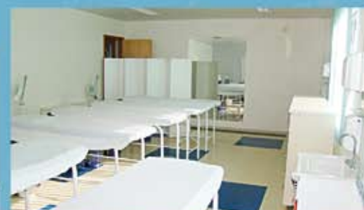
Laboratório de Estética