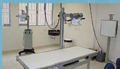
Laboratório de Radiologia