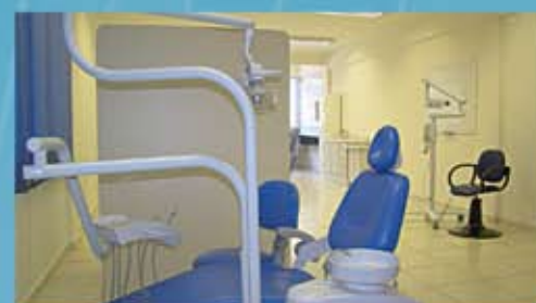
Laboratório de Higiene Dental