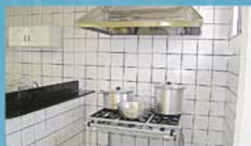
Laboratório de Nutrição