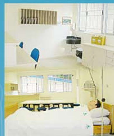
Laboratório de Enfermagem

Além dos laboratórios a escola conta com: