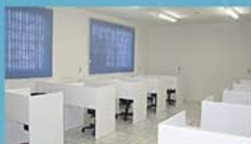
Laboratório de Prótese Dentária